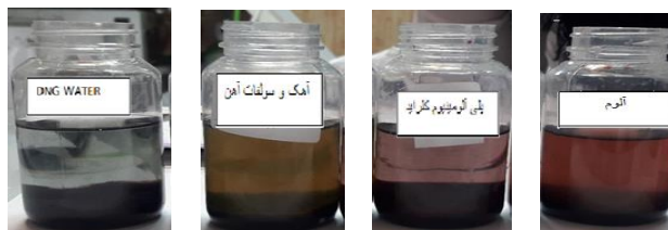
شکل شماره ۲. نتایج نهایی تصفیه پساب در مقیاس آزمایشگاهی

نتایج انعقاد در مقیاس آزمایشگاهی با مقدار مصرف ۰,۴ گرم بر لیتر در شکل شماره ۲ نشان داده شده است.